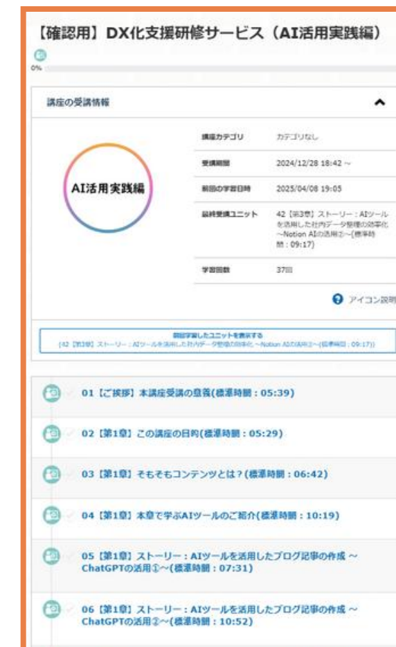
プラットフォームイメージ